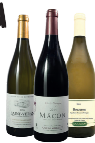
COFFRET DE VIN Un coffret sélection de vin 3 bouteilles