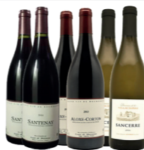
COFFRET DE VIN Avis aux épicuriens avec ce coffret 12 bouteilles