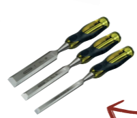
COFFRET CISEAUX À BOIS Complétez votre collection avec ce coffret de ciseaux à bois !