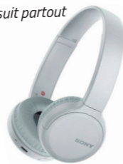
CASQUE SONY SANS FIL Votre musique vous suit partout