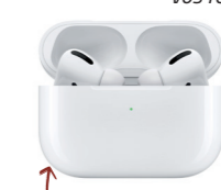
APPLE AIRPOD PRO Les écouteurs sans fil de référence, toujours dans votre poche