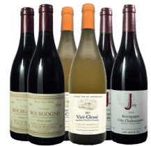
COFFRET DE VIN Stimulez vos papilles avec ce coffret 6 bouteilles