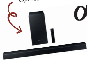
BARRE DE SON Montez le son et profitez d'une expérience immersive !