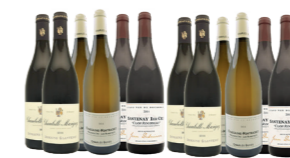
COFFRET DE VIN Le coffret : 24 bouteilles Entre classiques et découvertes faites voyager vos papilles