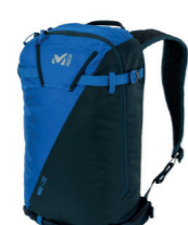
SAC À DOS MILLET À la journée ou à la 1/2 journée, ce sac à dos 20L est compact et ultra léger, le compagnon idéal pour vos sorties en ski !