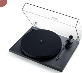
PLATINE AUDIOTECHNICA Une qualité audio unique (re)découvrez les plus grands classiques en vinyles avec cette platine, avis aux amateurs !