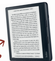
LISEUSE KOBO Besoin d'évasion ? Emportez vos romans où vous voulez !