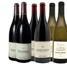
COFFRET DE VIN Amateur de bonnes choses, ce coffret 18 bouteilles est fait pour vous