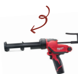
PISTOLET À COLLE Découvrez le pistolet à colle Milwaukee avec batterie M12