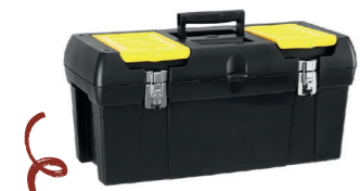
BOÎTE À OUTILS SÉRIE PRO Ranger vos outils n'aura jamais été aussi simple ! (outils vendus séparément)