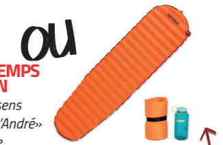
MATELAS AUTOGONFLANT Découvrez ce kit camping pour vos escapades en pleine nature