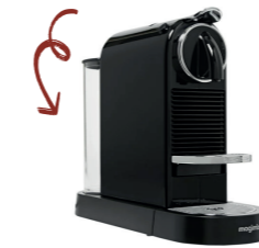
MACHINE À CAFÉ NESPRESSO Un café de qualité dans votre atelier ou votre bureau (dosettes classiques)