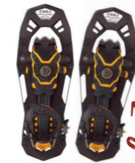
RAQUETTES Partez à la découverte des chemins enneigés avec ces raquettes !