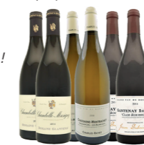
COFFRET DE VIN Le coffret : 18 bouteilles Dégustez un éventail de vins spécialement sélectionnés par des professionnels